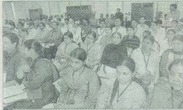
उद्योगों का विकास विषयक कार्यशाला में उपस्थित हस्तशिल्प ज्ञानगार।