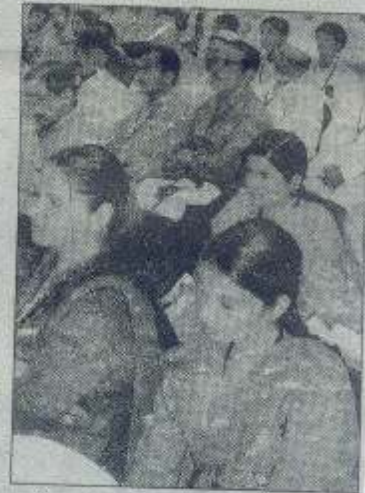
कार्यशाला में उपस्थित लोग।