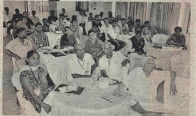
રાજ્યસ્તરની શિબિરમાં ઉપસ્થિત કોલિસેન શ્રોક તથા રાજ્યના જુદા-જુદા જિલ્લામાંથી આવેલા સંસ્થાના પ્રતિનિધિઓ દૃશ્યમાન થાય છે.

કે-સિન્ક ફાઉન્ડેશન-ભુજ અને ડિજિટલ એમ્પાવર ફાઉન્ડેશન-દિલ્હીના સંયુક્ત ઉપક્રમે ભુજમાં યોજાઈ રાજ્યસ્તરની કાર્યશિબિર